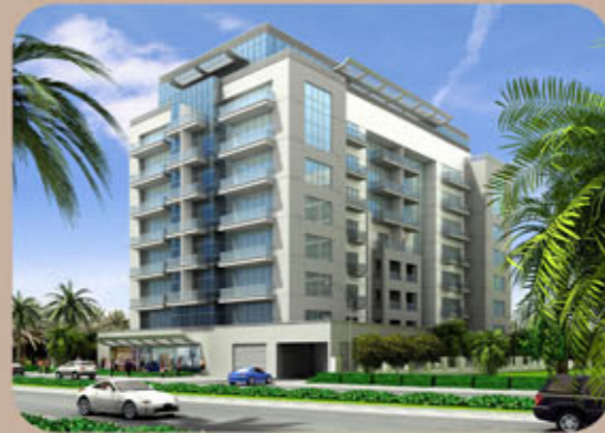
نعمان لیونا دہئی