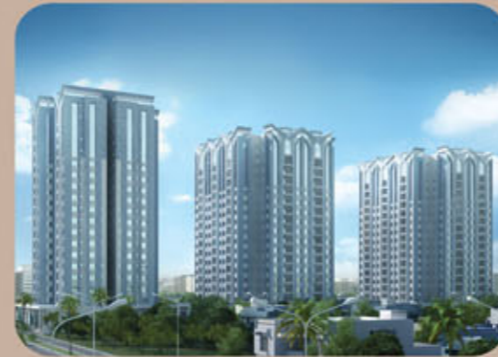
نعمان ریزیدنٹیا کراچی