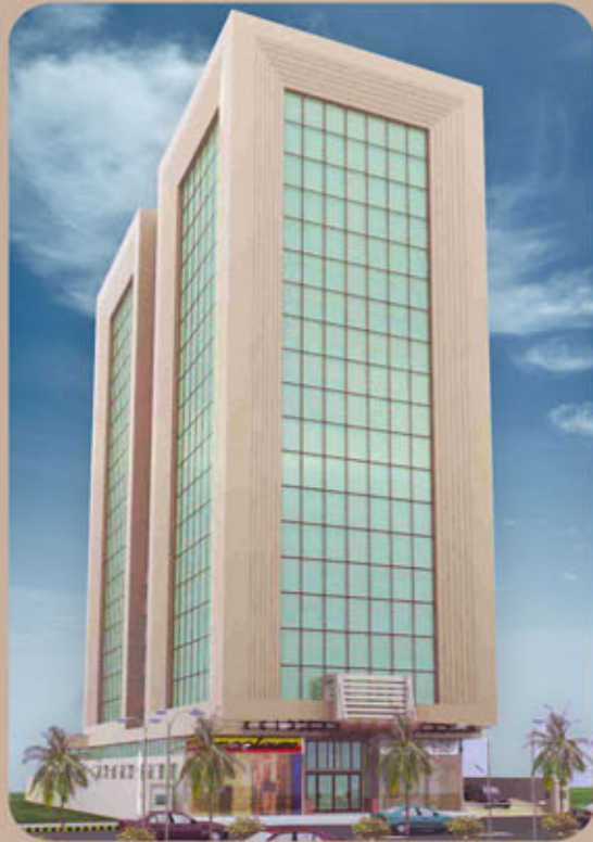
نعمان کسٹیلو کراچی

پلاننگ، کنسٹرکشن اور فنشنگ کے ہر مرحلے پر معیار کو یقینی بنانے کیلئے نعمان بلڈرز کے آرکیٹیکٹس، انجینئرز، ٹاؤن پلانرز ہمیشہ خوب سے خوب تر کی جستجو میں سرگرداں رہتے ہیں۔ نعمان بلڈرز کے تمام پروڈیکٹس جدید آرکیٹیکچر، عمدہ پلاننگ اور دیدہ زیب فنشنگ سے آراستہ ہیں اور باذوق لوگوں کی ترجیحات کے عین مطابق ہیں۔ اپنے وژن اور اعلیٰ پیشہ وارانہ روایات کی پاسداری کے ساتھ نعمان بلڈرز اب پیش کرتے ہیں کراچی کے تیزی سے ابھرنے والے علاقے میں ایک اور شاندار رہائشی منصوبہ نعمان رائل سٹی۔